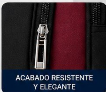
ACABADO RESISTENTE Y ELEGANTE