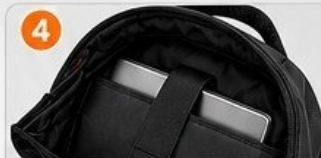
PORTA COMPUTADOR ACOLCHADO