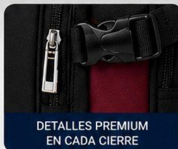
DETALLES PREMIUM EN CADA CIERRE