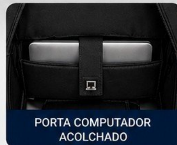
PORTA COMPUTADOR ACOLCHADO