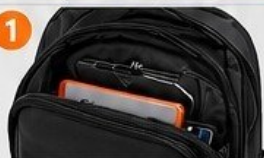
BOLSILLO FRONTAL DE ACCESO RÁPIDO