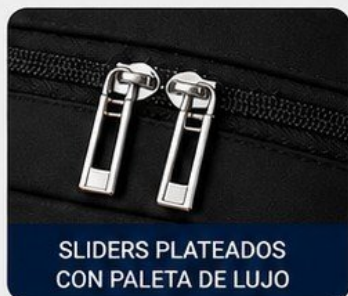
SLIDERS PLATEADOS CON PALETA DE LUJO